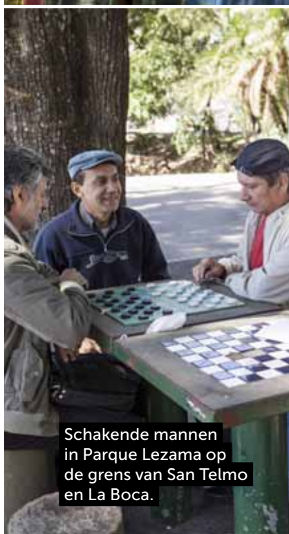
Schakende mannen in Parque Lezama op de grens van San Telmo en La Boca.

kleuren geschilderd: rood, geel, groen ... Overal op straat verkopen lokale artiesten hun tekeningen en schilderijen. Op de vele terrasjes klinkt muziek en zien we tangodansers. La Boca was ooit een zeeliedenbuurt en is de bakermat van de tango. We komen langs een onverwachte parel: Fundacion Proa. Dit museum met wisselende (foto)exposities zit in een koloniaal pand dat grondig werd gerenoveerd en een hypermodern uiterlijk kreeg. Het dakterras – een heerlijke lunchplek – kijkt uit op de oudste haven van Buenos Aires.