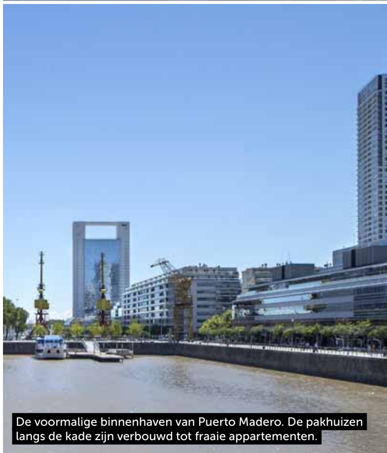
De voormalige binnenhaven van Puerto Madero. De pakhuizen langs de kade zijn verbouwd tot fraaie appartementen.