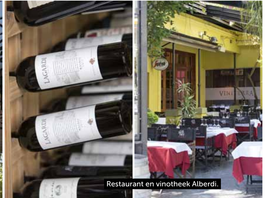
Restaurant en vintoeek Alberdi.