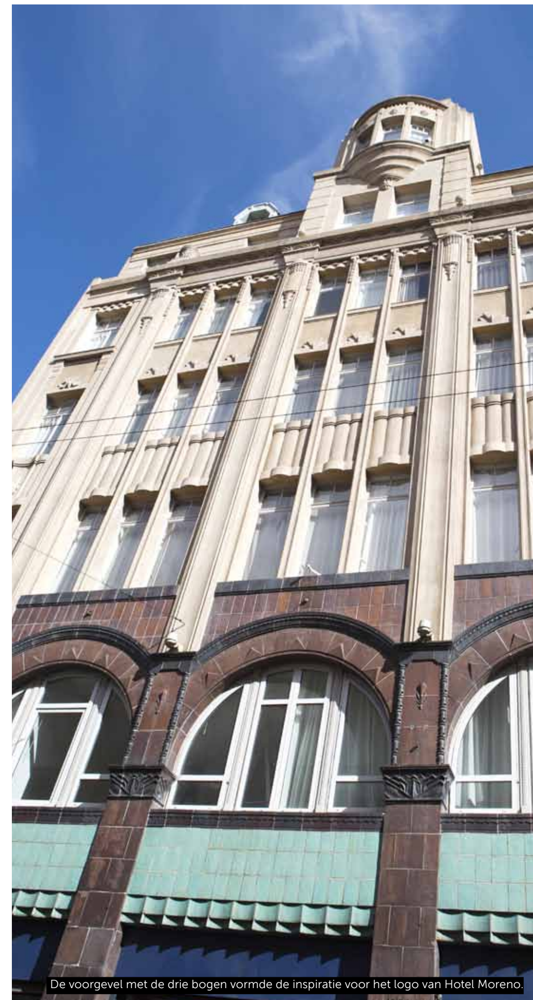
De voorgevel met de drie bogen vormde de inspiratie voor het logo van Hotel Moreno.