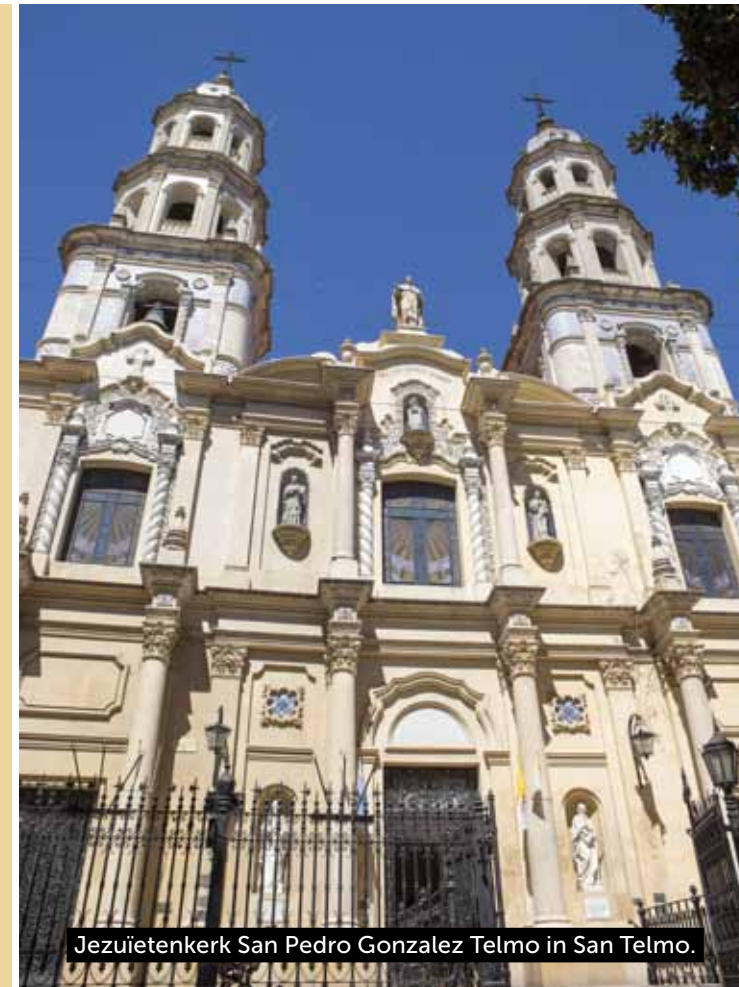
Jezuïetenkerk San Pedro Gonzalez Telmo in San Telmo.

De snelste en beste manier om je in Buenos Aires van wijk naar wijk te verplaatsen is met de taxi. Kies voor de Radio-taxi's: genummerde zwart-gele auto's voorzien van een meter. Binnen de wijken zelf kom je wandelend of met de fiets een heel eind.