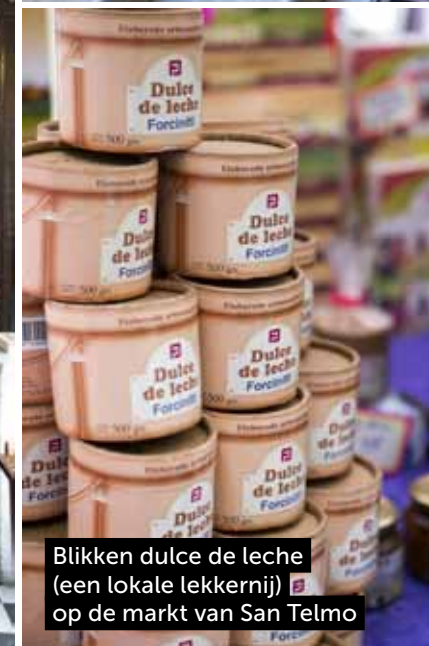
Blikken dulce de leche (een lokale lekkernij) op de markt van San Telmo