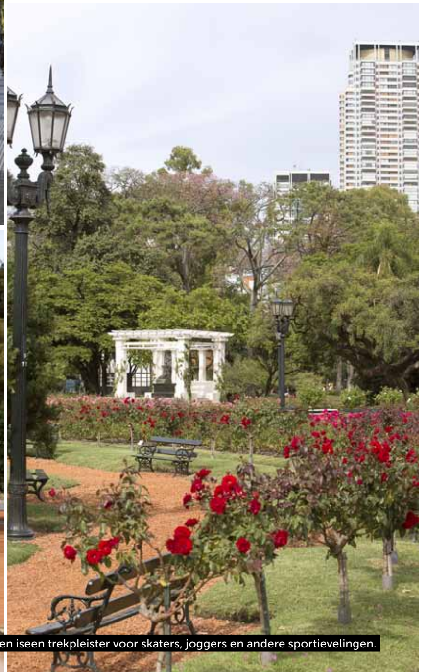
El Rosedal, de rozentuin in de wijk Palermo. Het park eromheen is een trekpleister voor skaters, joggers en andere sportievelingen.