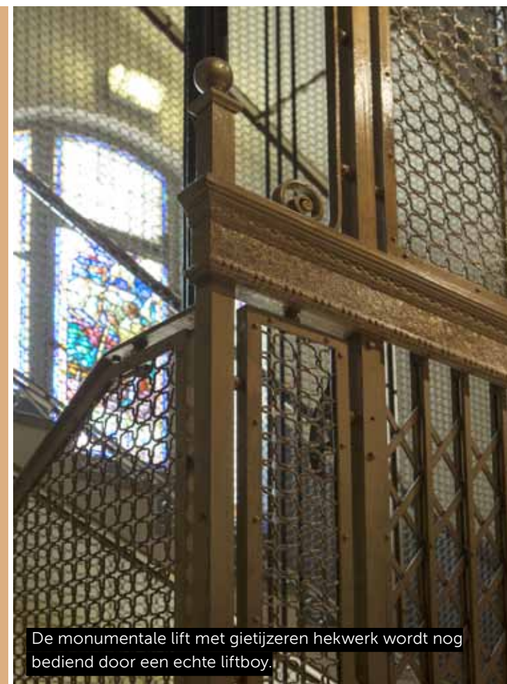
De monumentale lift met gietijzeren hekwerk wordt nog bediend door een echte liftboy.

guratie in maart 2013 aartsbisschop was. Op het terras van het Moreno prijkt ook een 'sky-jacuzzi' en er zijn plannen voor een fitnessruimte op het dak. Een verblijf in Hotel Moreno is natuurlijk niet compleet zonder een lunch of diner bij Aldo's, het inspannende restaurant annex vintoeke. Vrijwel alle wanden zijn er bedekt met flessen wijn. De ruimte onder Aldo's wordt omgetoverd tot tangobar, waar je lessen en shows kunt bijwonen. En wat past er nu beter bij het bruisende Buenos Aires dan dat? •