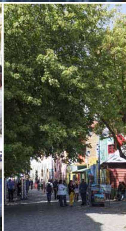
Tangomuziek op de terrasjes zet de sfeer.