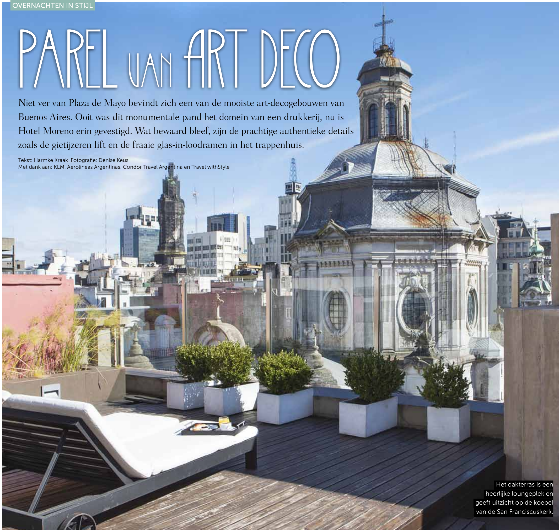
Het dakterras is een heerlijke loungeplek en geeft uitzicht op de koepel van de San Franciscuskerk.

Tekst: Harmke Kraak Met dank aan: KLM, Aerolíneas Argentinas, Condor Travel Argentina en Travel withStyle