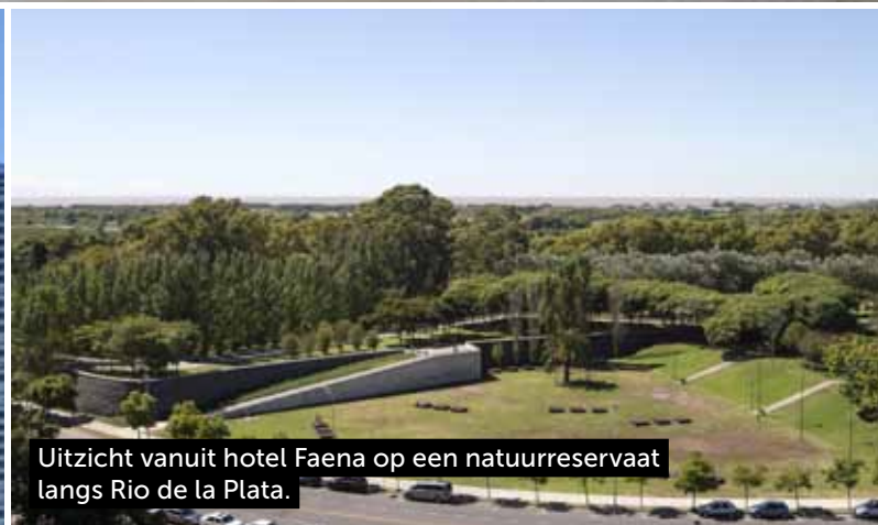
Uitzicht vanuit hotel Faena op een natuurreserveaat langs Rio de la Plata.