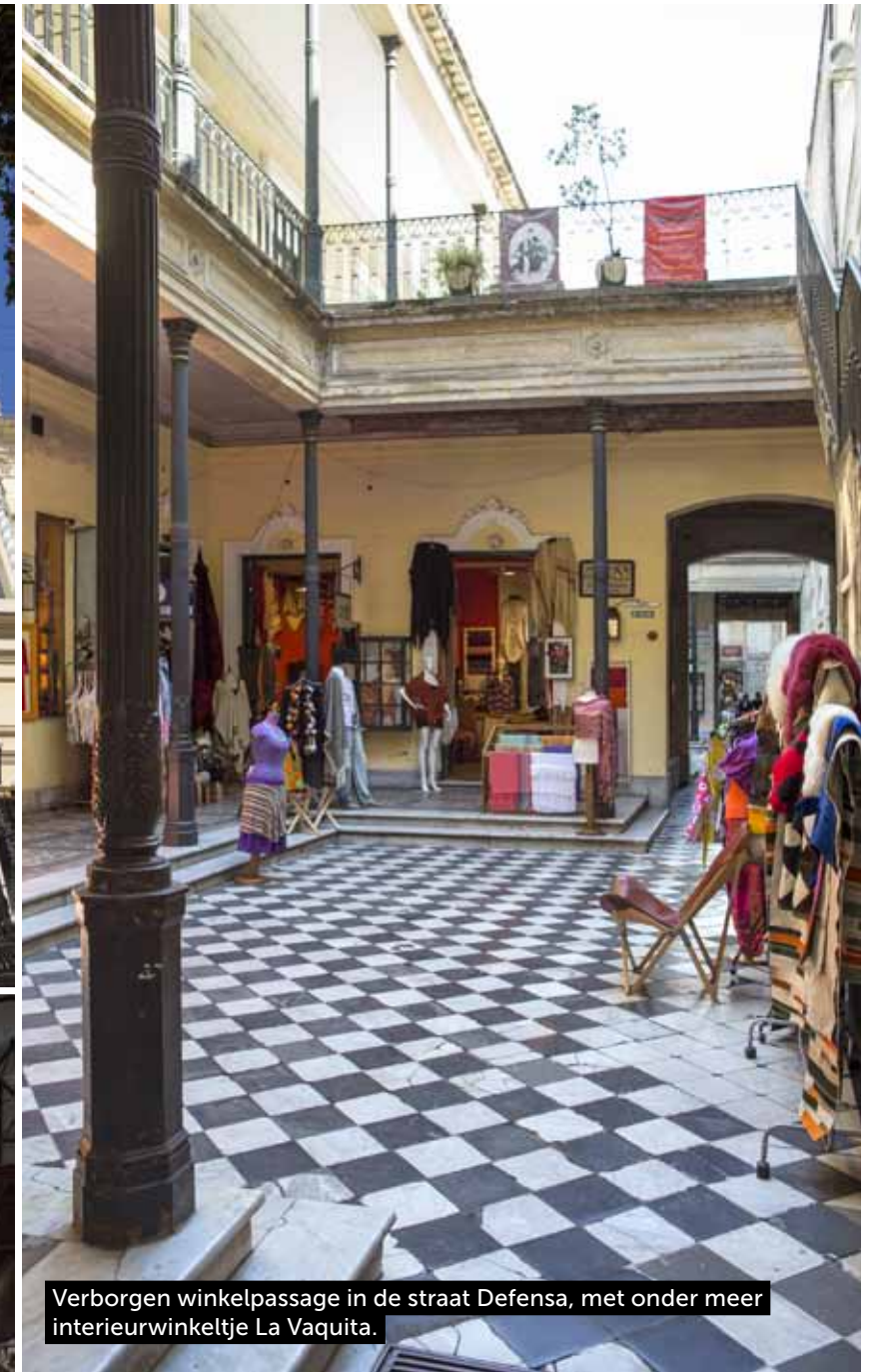
Verborgen winkelpassage in de straat Defensa, met onder meer interieurwinkeltje La Vaquita.