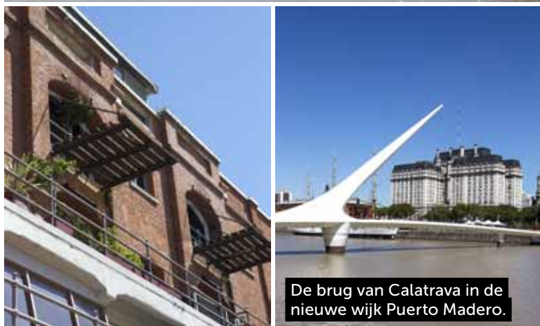
De brug van Calatrava in de nieuwe wijk Puerto Madero.