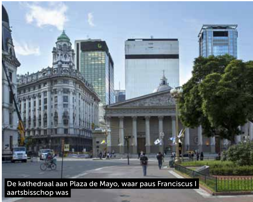
De kathedraal aan Plaza de Mayo, waar paus Franciscus I aartsbisschop was