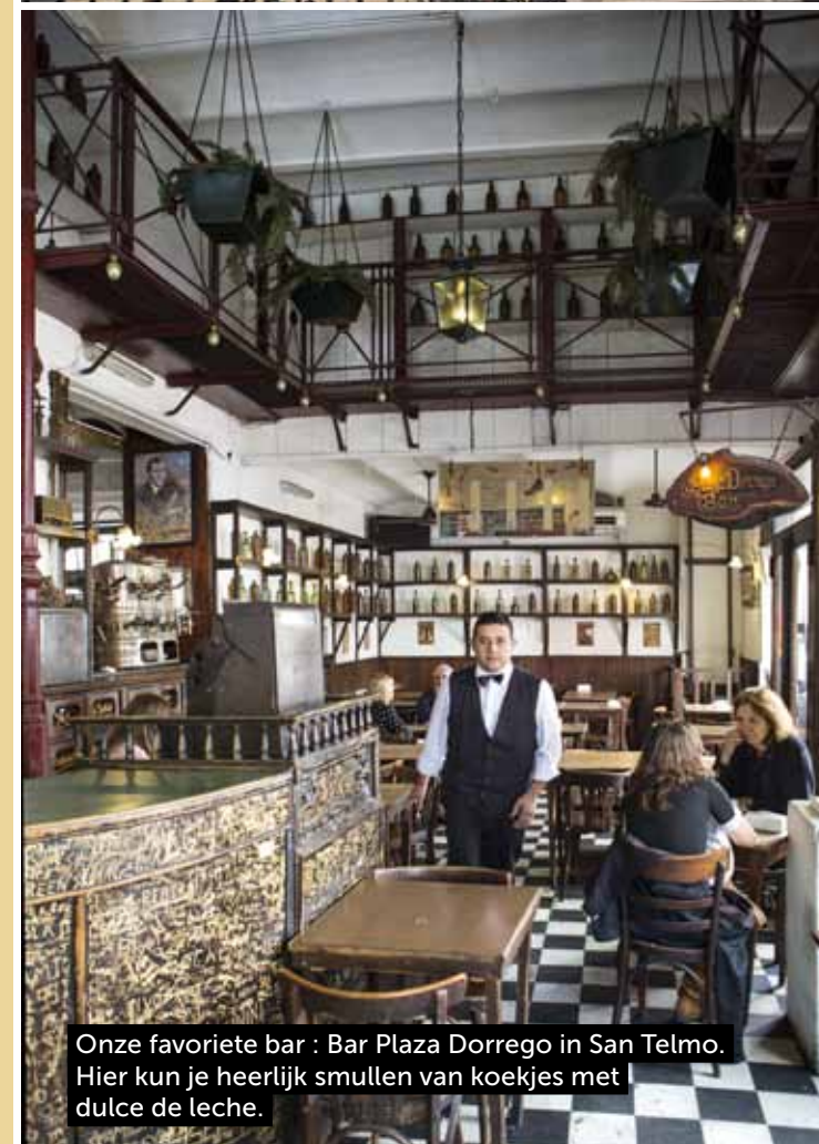
Onze favoriete bar : Bar Plaza Dorrego in San Telmo. Hier kun je heerlijk smullen van koekjes met dulce de leche.