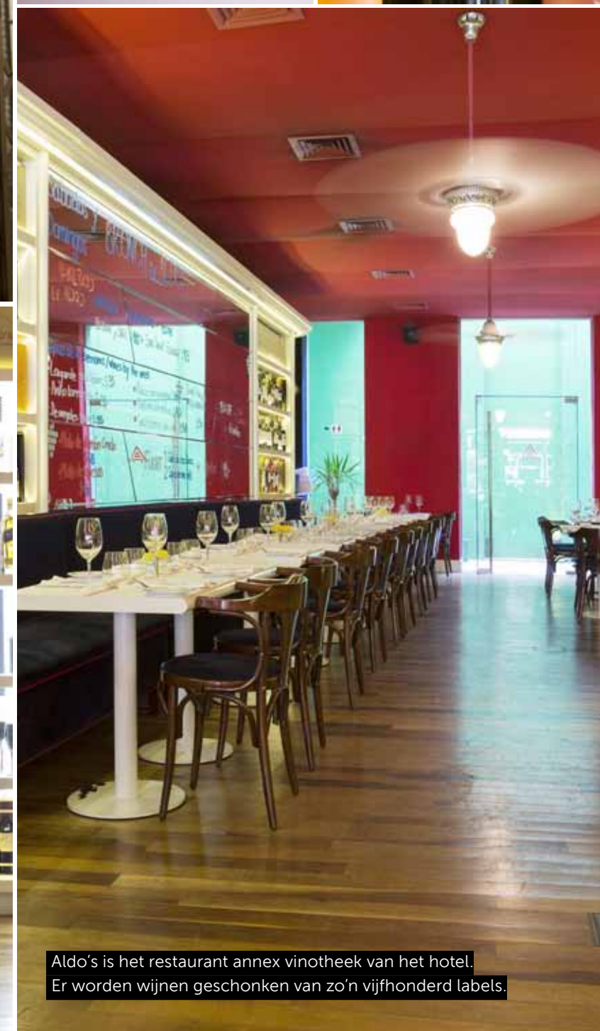
Aldo's is het restaurant annex vintoeke van het hotel. Er worden wijnen geschonken van zo'n vijfhonderd labels.